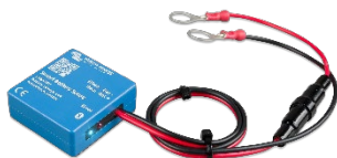
Bluetooth-detectie Smart Battery Sense