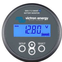
Bluetooth-detectie BMV-712 Smart Battery Monitor