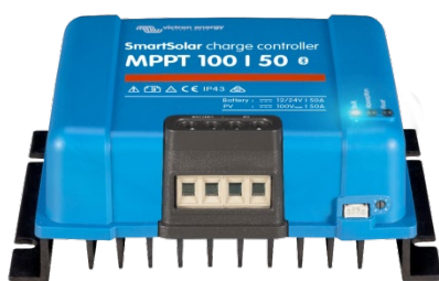
SmartSolar Laadcontroller MPPT 100/50

Een Smart Battery Sense of een BMV-712 Smart Battery Monitor kunnen gebruikt worden om batterijspanning en temperatuur te communiceren naar één of meer SmartSolar Oplaadregelaars.